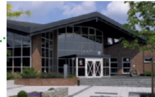
Gartenbauzentrum Münster-Wolbeck Münsterstr. 62 – 68 48167 Münster

Schwerpunkt der Arbeit in Münster-Wolbeck ist die überbetriebliche Ausbildung im Gartenbau, die von hier aus für ganz Nordrhein-Westfalen geplant wird und alle fachlichen Lehrgänge vor Ort durchführt. Außerdem steht Münster-Wolbeck federführend für die berufliche Weiterbildung im Gartenbau für alle gartenbaulichen Schwerpunkte. (MS-G)