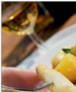
Feiern / Tagen / Partyservice