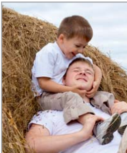
Ferienhöfe / Heuherbergen

Landwirtschaftskammer Nordrhein-Westfalen