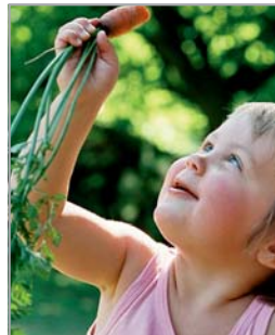
Landerlebnisse für Kinder