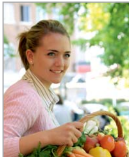
Landfrische Pro- dukte / Hofläden