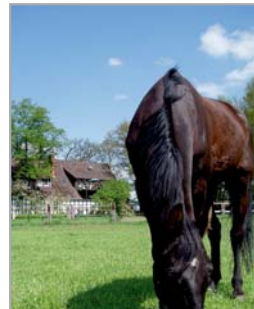
Reiterhöfe / Pferdepensionen