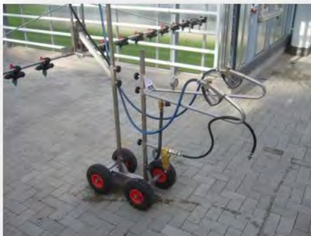
Hier können die beiden Handventile als Zentralabschaltung gewertet werden