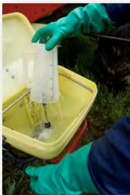
Spülen des Messzylinders möglich