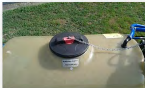
Deckel mit Druckausgleichsfunktion