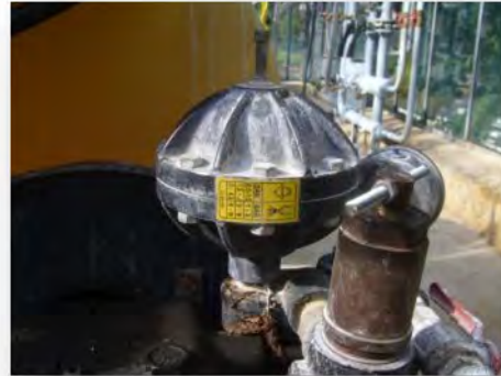
Windkessel entsprechend des Spritzdruckes befüllen