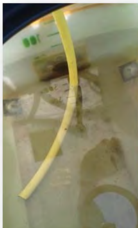
Wenn nur ein freier Rücklauf vorhanden ist, muss ggfls. Ein Rührwerk eingebaut werden