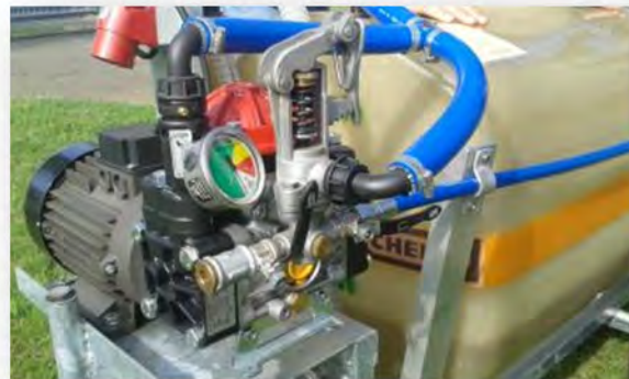
Nur zulässig, wenn im Nahbereich gearbeitet wird (schnelle Erreichbarkeit)