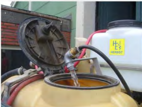
Lücke zwischen Befüllung und Fass