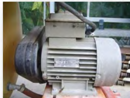
Schutz muss intakt sein