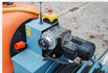
Offener Bereich – mit Schutz versehen!!!