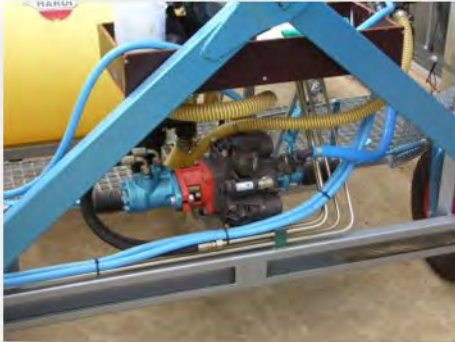
Ölstand zur Dämpfung beachten