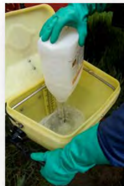
Spülen des PSM-Gebindes möglich