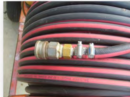
Schlauchsellen bei Hochdruckschläuchen geht nicht (⇒ müssen verpresst werden)