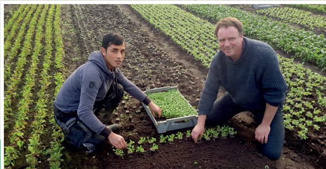
Landwirtschaftsbetrieb Bobbert

Profitieren Sie von der Beratung durch die Willkommenslotsen!