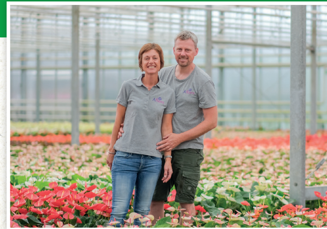
Gärtenbau-Betrieb Opschroef