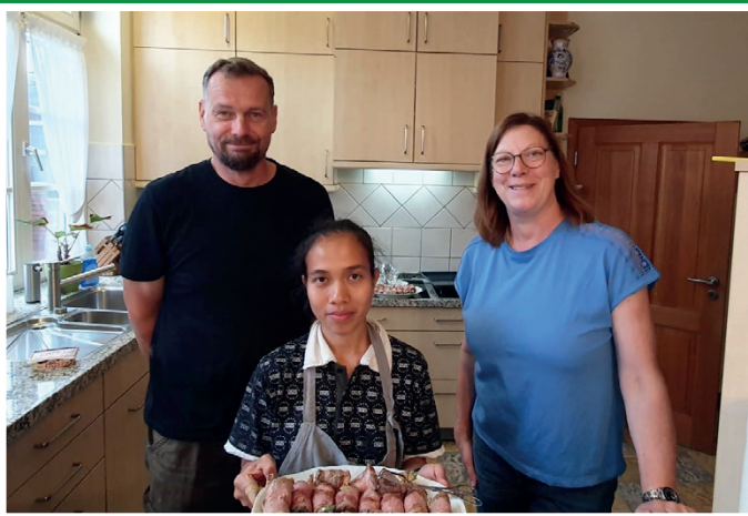
Haus- und Landwirtschaftsbetrieb Halsbenning