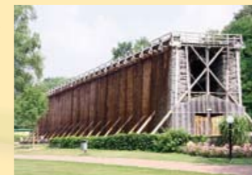
Saline im Kurpark Bad Sassendorf

Darüber hinaus besteht die Möglichkeit, in Eigenregie Bad Sassendorf (Kurpark, Saline, Thermalbad, Sauna) zu erkunden.