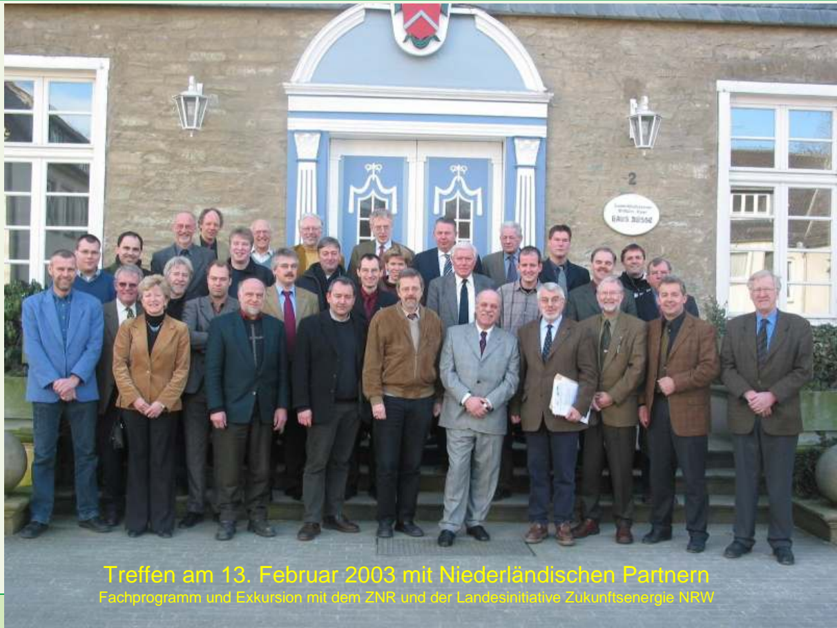
Treffen am 13. Februar 2003 mit Niederländischen Partnern Fachprogramm und Exkursion mit dem ZNR und der Landesinitiative Zukunftsenegie NRW