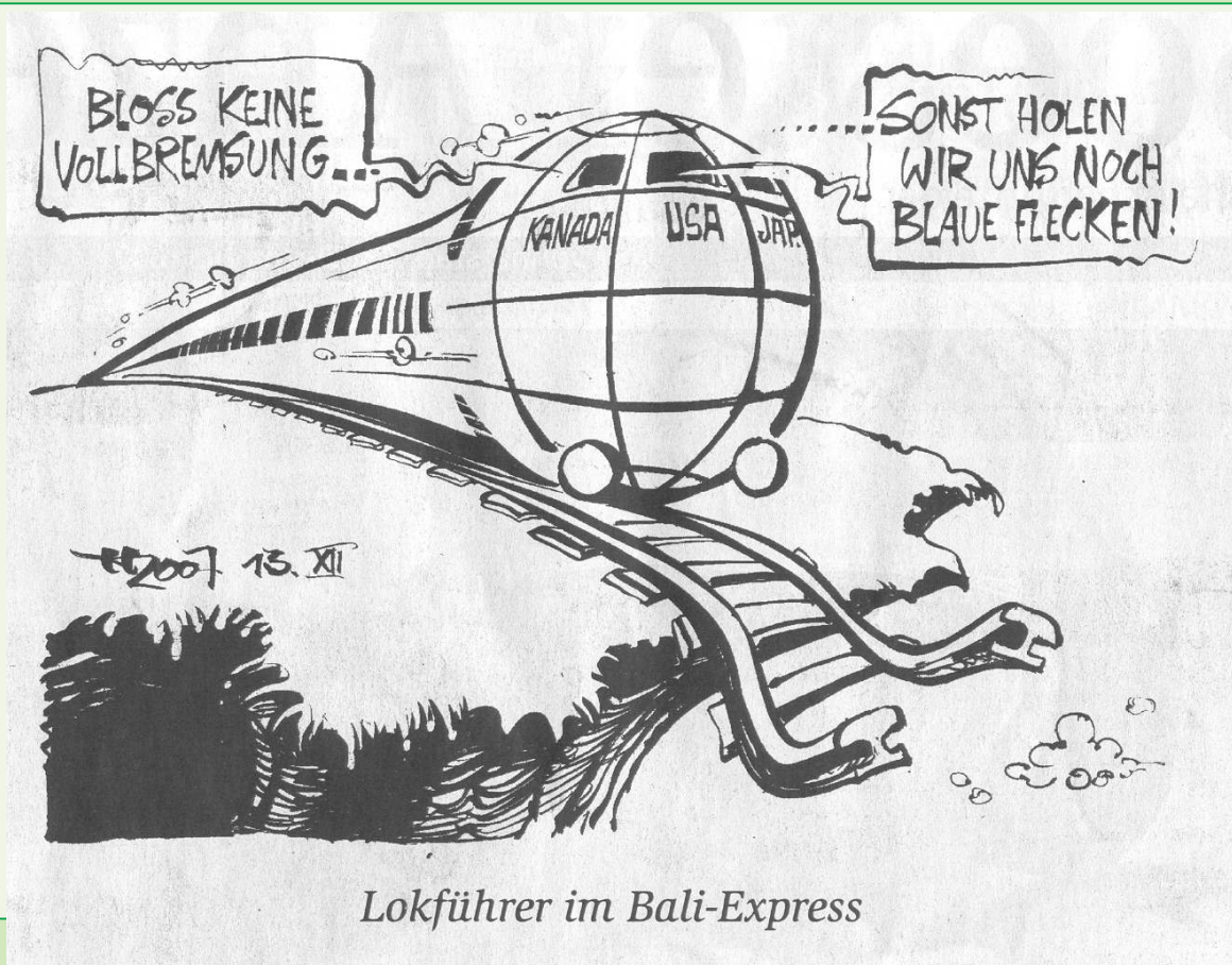
Lokführer im Bali-Express