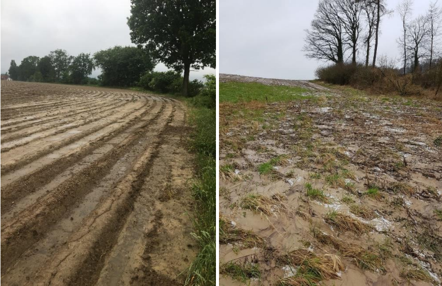
Abbildung 7: Fehlender Bewuchs und Erosion am Hang

Ziel: Ein ganzjähriger Bewuchs der Hangfüße.