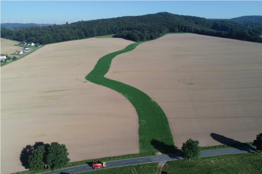
Abbildung 10: Erosionsschutzstreifen in der Hangrinne

Ziel: Die Vermeidung von starken Erosionen in den Hangrinnen.