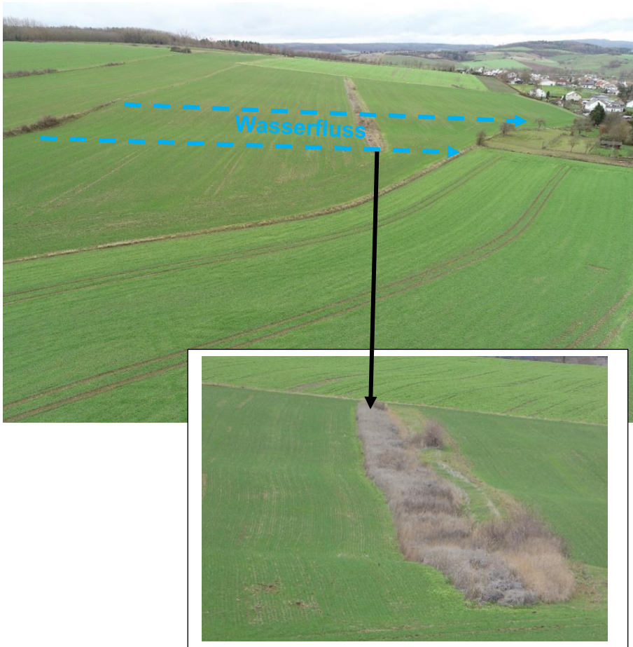
Abbildung 9: Erosionsschutzstreifen im Schlag zur Unterbrechung der Hangrinne