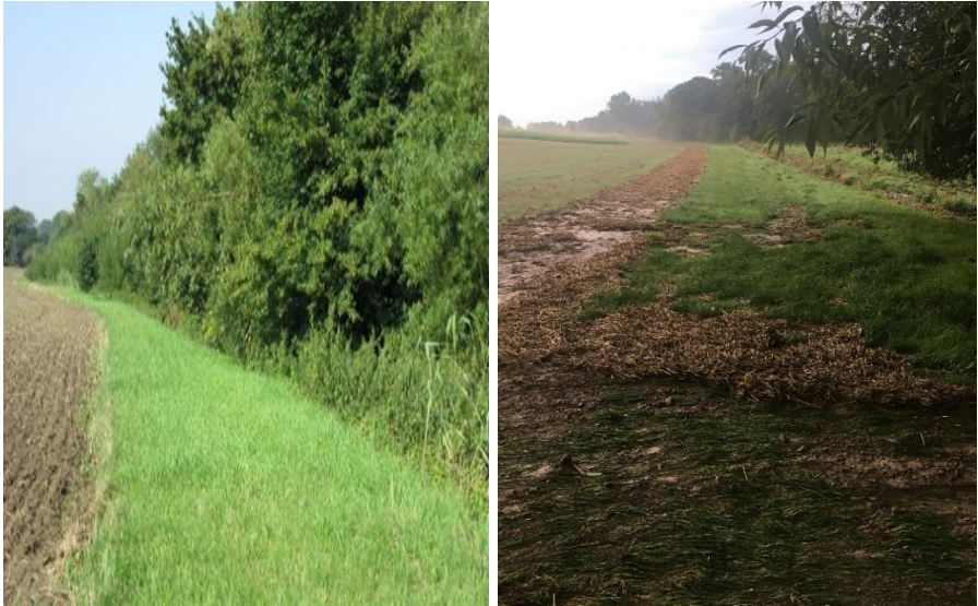
Abbildung 8: Ackerflächen mit Uferrandstreifen

und zum anderen hat das Bodenmaterial Zeit sich abzulagern. Dadurch wird das Wasser dem Vorfluter, der Straße und den Wegen langsamer und sauberer zugeführt.