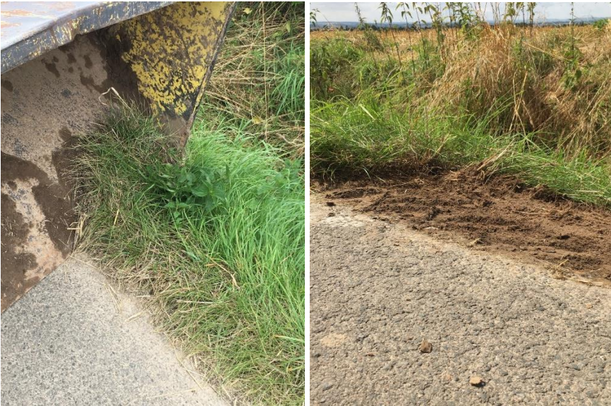
Abbildung 11: Grabenkante vor der Begradigung mit der Schaufel (links) und nach der Begradigung (rechts)

Ziel: Das Ableiten von Wasser in die Gräben, um einen kontrollierten Abfluss zu gewährleisten.