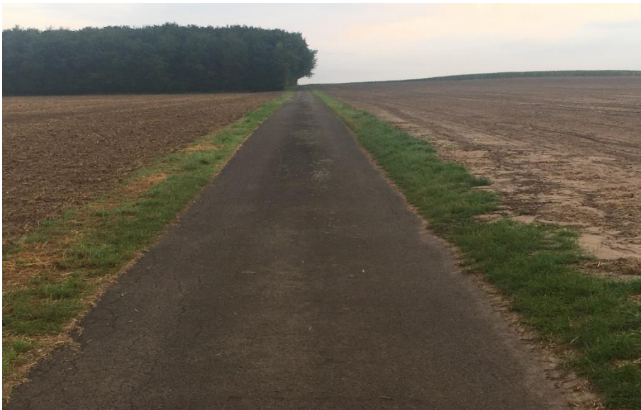
Abbildung 1: Vergleich von Mulchsaat (links) und Pflugsaat (rechts)

Aufprall der Regentropfen (Splash-Effekt) entgegen, zum anderen kann das Niederschlagswasser besser in den Boden eindringen, wodurch weniger Wasser oberflächlich abfließt. Dazu tragen auch die versickerungsfördernden Grobporen und Regenwurmgänge bei, die durch die Mulch- und Direktsaat weniger unterbrochen werden. In erosionsgefährdeten Gebieten können die potentiellen Nachteile der pfluglosen Bestellung der Ackerflächen, wie zum Beispiel ein erhöhter Krankheits- oder Unkrautdruck, in Kauf genommen werden, da in Regionen mit erhöhter Gefahr des Bodenabtrages die Vorteile einer Mulchsaat überwiegen.