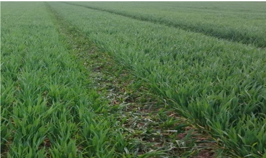
Abbildung 6: Eine bewachsene Fahrgasse in einem Getreidebestand