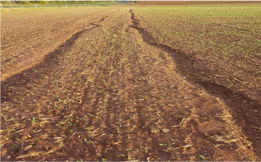
Abbildung 5: Rinnenerosion durch einen unbewachsenen Fahrstreifen