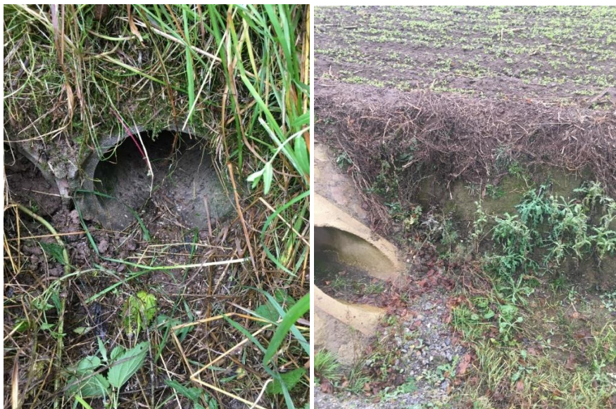
Abbildung 12: Verschmutzte Gräben-Durchlässe

Damit das Wasser durch die Gräben abfließen kann, müssen diese und vor allem auch die „Durchlässe“ frei sein. Für die Gräben sind hierfür in der Regel die Kommunen oder Wasserverbände zuständig. Die Überfahrten mit entsprechenden „Durchlässen“ müssen allerdings von den Grundstückeigentümern freigehalten werden. In der Abbildung 12 sind „Durchlässe“ zu sehen, die nicht frei von Erde und Pflanzenteilen sind und somit einen einwandfreien Abfluss des Wassers verhindern können.