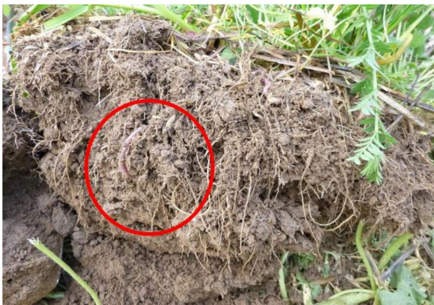
Abbildung 2: Durch die Zwischenfrucht geförderte feinkrümelige Bodenstruktur

Zwischenfrucht gefördert wird und somit ein besseres Versickern von Wasser in den Unterboden gewährleistet. Untersaaten erfüllen den gleichen Zweck bereits während der Vegetation von Hauptkulturen, insbesondere in Reihen bestellten Kulturen wie Mais, aber auch in Kartoffeln- und Getreidebeständen. Nach der Ernte der Hauptfrucht sorgen Untersaaten zudem für einen zügigen flächendeckenden Bestand auf der Fläche.