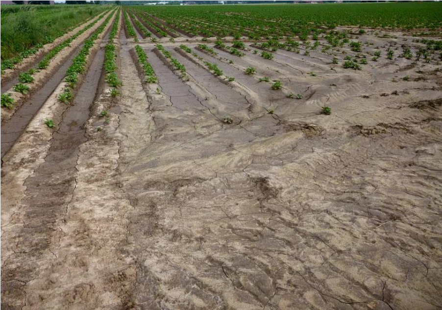
Abbildung 3: Reihenkulturen wie die Kartoffel sind anfälliger für Erosionsereignisse

Beispiel Klee gras oder Getreidekulturen. Zudem sollte der Bodenbedeckungsgrad der Kulturen möglichst hoch sein. Auch ein ausgewogenes Verhältnis zwischen humusmehrenden und humuszehrenden Fruchtarten sollte angestrebt werden.