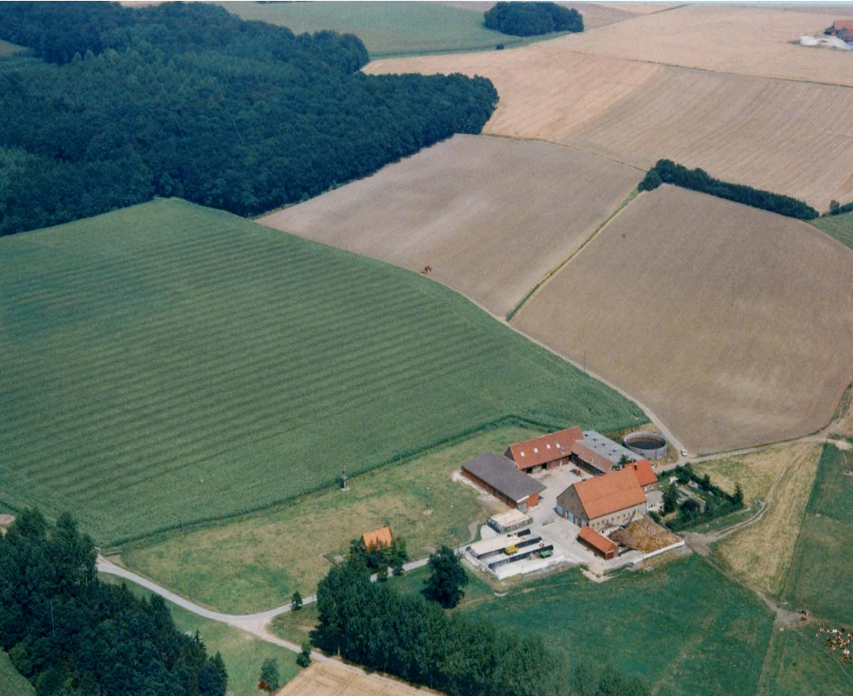
Luftbildaufnahme einer landwirtschaftlichen Hofstelle