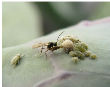
Blattlausschlupfwespen legen ihre Eier in Blattläuse ab