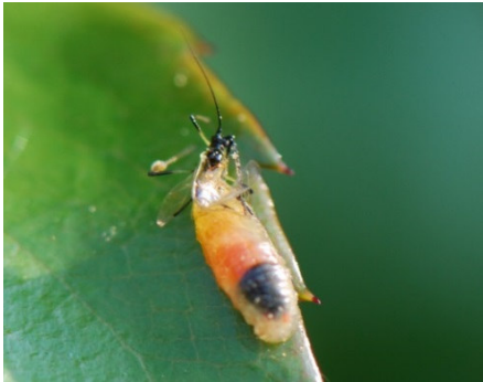
Larve einer Schwebfliege saugt Blattlaus aus

Auch das Anpflanzen von attraktiven Blütenpflanzen, die gerne von den Nützlingen angefliegen und besucht werden, kann mit dazu beitragen, das Auftreten von Nützlingen im Garten zu fördern. So lassen sich z. B. Schwebfliegen durch das Anpflanzen von attraktiven Blütenpflanzen wie Korb- und Doldenblütlern anlocken und fördern. Vielleicht findet sich in Ihrem Garten auch irgendwo eine Ecke, in der Sie Wildpflanzen ungestört wachsen lassen können. Diese werden dann sicher ebenfalls gerne von Nützlingen aufgesucht und als Lebensraum angenommen.