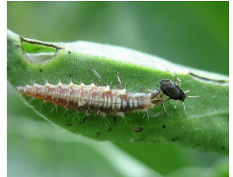
Florfliegenlarve mit einer Blattlaus als Beute

Speziell für Florfliegen gibt es darüber hinaus rotbraune, mit Stroh gefüllte Florfliegenhäuschen, die man im Garten aufstellen kann, um den Florfliegen einen Unterschlupf für die Überwinterung im Garten anzubieten. Ohrwürmer lassen sich auch mit umgedrehten und mit Stroh, Heu oder Holzwole gefüllten Tontöpfen ansiedeln, die man hierzu z. B. in die Obstbäume hängt.