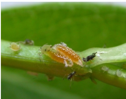
Larven der räuberischen Gallmücke

Speziell für Florfliegen gibt es darüber hinaus rotbraune, mit Stroh gefüllte Florfliegenhäuschen, die man im Garten aufstellen kann, um den Florfliegen einen Unterschlupf für die Überwinterung im Garten anzubieten. Ohrwürmer lassen sich auch mit umgedrehten und mit Stroh, Heu oder Holzwole gefüllten Tontöpfen ansiedeln, die man hierzu z. B. in die Obstbäume hängt.