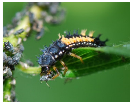
Marienkäferlarve frisst Blattlaus