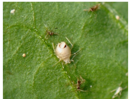
Von einer Schlupfwespe parasitierte und abgetötete Blattlaus

Wichtig ist es vor allem aber auch, dass Nützlinge vom Hobbygärtner überhaupt erkannt und nicht als vermeintliche Pflanzenschädlinge bekämpft werden. Kontrollieren Sie die Pflanzen vor einer eventuellen Bekämpfungsmaßnahme daher immer erst ganz genau und überprüfen Sie, ob ihre Pflanzen tatsächlich nur von Schädlingen und nicht eventuell bereits auch von Nützlingen besiedelt sind – denn dann ist eine Bekämpfung oft gar nicht mehr erforderlich.